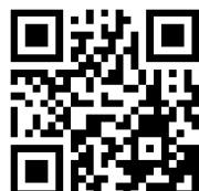
基礎版必修試卷 u pep.hk/z5kxc