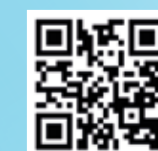
吸管排笛示範影片