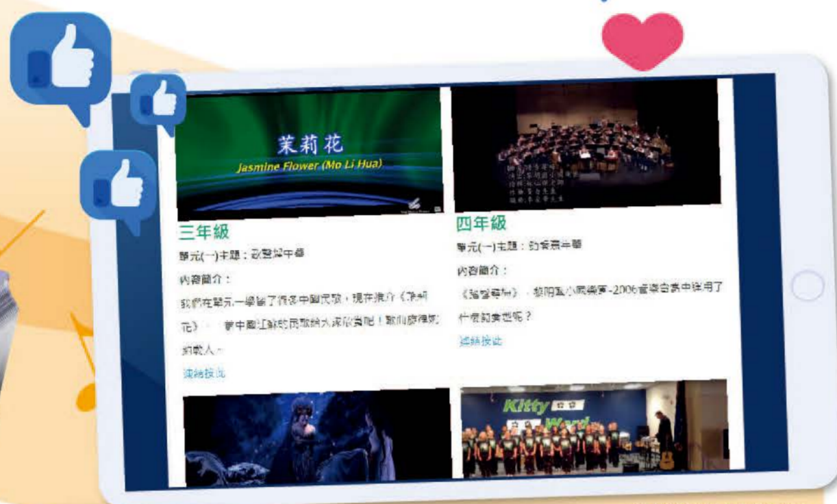
音樂藝術自學寶庫

陳主任又會邀請學生表演或演奏，然後請其他學生給予意見，提升學生的評鑑能力。為帶動網上學習音樂的氣氛，幾位音樂科老師都積極投入在音樂表演及創作的工作，例如用不同樂器演奏自行改編的流行曲，提升學生學習音樂的興趣。